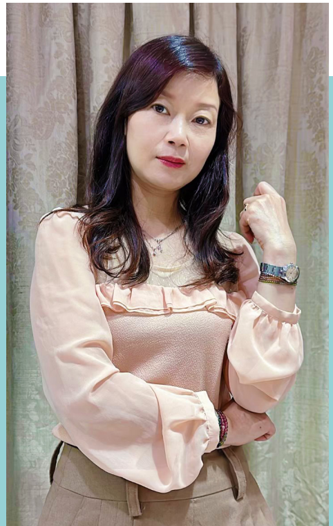
2010年1月加入生麗 2010年5月榮陞主任 2018年2月榮陞經理 2023年10月榮陞鑽石

我從事美容行業18年，13年前臉上莫名出現膚色不均勻及暗沉，當我在服務客人時都心虛的覺得，客人的皮膚狀況都比我還要好，因是近距離服務客人，禮貌上我都戴著口罩，不想讓看到我的臉，有天家人聚餐，姐姐也關心我皮膚怎麼了？隔天我就主動找阿姨拿一套生麗保養品，真的改善了我的問題肌膚，我也分享給朋友，朋友還非常滿意的說如果可以活到100歲，也會用愛用生麗保養品到100歲，未來我會把生麗結合我的工作，幫助更多伙伴變漂亮，也願所有伙伴都能擁有健康！自信！美麗！財富！