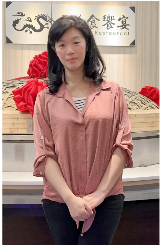
2022年1月加入生麗 2023年3月榮陞經理 2023年10月榮陞寶石

開始使用生麗後，它真的神奇又速效，不到一個月我的毛孔粗大、斑點就幾乎淡去70%，只剩難纏的顴骨母斑，現在也還持續淡化中，皮膚變好了，客人看見有些人也會好奇問我，是如何保養的，最有感的是我的家人看到我快速的改變，甚至讓我決定斜槓這份事業，來幫助更多人皮膚改善，他們也都很支持我。看見生麗公司也做慈善的捐贈，幫助更多需要的人，讓我更確信它不但研發做出好的產品，也回饋社會，這樣的公司是值得我跟隨的，我很願意帶領更多人來參與生麗，支持生麗，讓大家跟著生麗，什麼都會有。