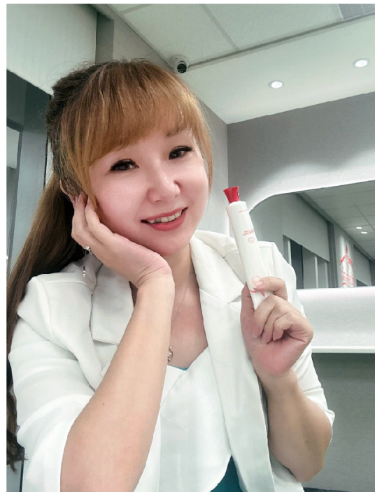
2022年7月加入生麗 2023年3月榮陞經理 2023年12月榮陞寶石

但就在我要放棄臉蛋漂亮這件事時，我生命中的貴人玲紅鑽石就出現了！她告訴我這套保養品一定可以使我美麗動人，沒想到奇蹟真的發生了，使用生麗沒多久後我就覺得真的跟一般保養品不一樣，還跟她說：「這麼好的產品怎麼現在才跟我說」看著自己皮膚一天天的越來越好，我決定全心投入經營生麗事業；沒想到，我只是簡單跟著公司的活動，運用上課所學的方法做，居然讓我從原本要花錢用保養品變成免費用保養品，甚至到現在我的收入遠比一般上班族還更豐厚！所以，我發了一個願：我決定要用這套好的保養品去幫助更多需要改善肌膚問題的人，以及去幫助想要改變自己人生的人！